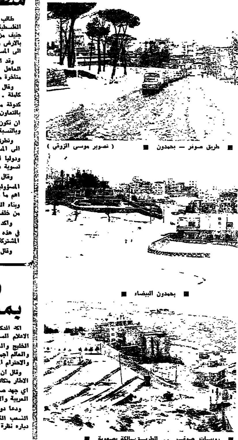
طريق صور - بجدون